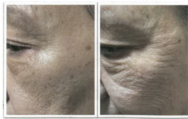
※商品の体感には個人差がございます。

り、ズキズキが楽になったりすると聞いたので、俄然興味湧いてワクワクしてきて、使い始めて一年も経った頃、『摩訶クリーム』と一緒に使っていたオールインワンのジェルがちょうどなくなってきたので、娘が持っていた『摩訶ゴールドホワイトニングローション』(以下、『摩訶ローション』)を借りて『摩訶クリーム』と一緒に使ったら、以前の働きの何倍もそのスゴさで即効性を感じたので、これはシリーズで使ってみようと思ったんです。その時娘に、どうも『摩訶クリーム』は他の製品と併せて使うとその働きが十分発揮できなくなるみたいと言われたのを思い出しました。