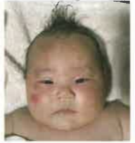
こんなに赤くプツプツしていた肌もツルツルに!

「摩訶クリーム」はその少し前から「これは良さそう」との直感から使っていました。ただ「肌は擦らない」のがエステティシャンの鉄則なので、最初の2ヶ月はただ大量に塗るだけでした。でも肌表面に溜まった帯電を動かして放出させるイメージで、「摩訶クリーム」をグリグリと擦り込む塗り方に変えたら、アースを助けてくれる感覚もあつて3倍くらい加速してラクになったので、「この方法だ!」と確信したんです。同じような状態の赤ちゃんもお子さんも、肌をしっかりと動かすように塗り込んだらすつかりキレイに! 変化するのも非常に早かったです。「こする」のではなく、「細かく動かす」といいですね。 また、急に髪が抜けるようになって困つて来られた方に「摩訶クリーム」を塗り続