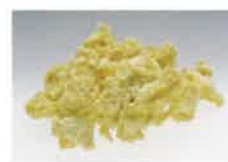
超臨界抽出によるプロポリス

二酸化炭素(炭酸ガス)に35~40℃の温度で超高压を加えると、気体でもない液体でもない「超臨界流体状態」となります。この状態の二酸化炭素には、プロポリスの原塊からエキスを溶かし出すなどの、強い溶解能力が生まれます。この動きを利用し、無酸素状態で自然のまま、プロポリスの有用成分を抽出する方法が「超臨界製法」です。