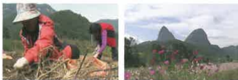
良質な紅参が多く栽培される馬耳山(マイサン)で収穫

中国最古の医学書「神農本草経」にも「五臓を捕い、身を軽くして、長寿延命す」と、その薬効が記載しており、上薬中の上薬に分類されております。また、古来より王様への献上品として大変、貴重な物で、金と同じ価格とされていました。