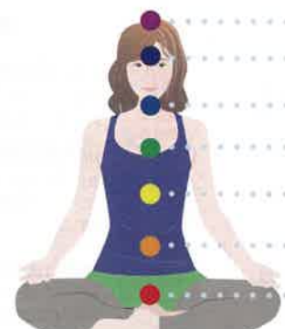
お風呂あがりに、7つのチャクラ(エネルギーセンター)に『摩訶クリーム』をやさしく擦り込むケアをすると、エネルギー調整になるのだとか!

チャクラに『摩訶クリーム』を塗った後で瞑想をすると、エネルギーの循環が層よくなるのでオススメです。頭頂からキレイなエネルギーが入ってきて丹田に落ち着くイメージで深い呼吸とともに行うといいですよ。