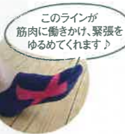
このラインが筋肉に働きかけ、緊張をゆるめてくれます。

どのソックスでも作用は同じですので、フリルとラメがおしゃれな『フレクサー・ボディマジックソックス』や、靴から見えない『フレクサー・スニーカーソックス』などお好きなものをお選びください。