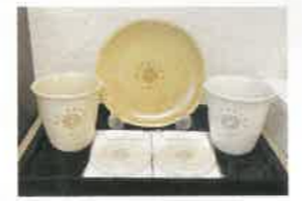
オリジナルデザインのヒーリンググッズ。持つと、からだの不調がやわらかく大人気♪

ていただくのですが、自分で元気 になろうとする力が何よりも大 切なので「ありがどう」は、ご自分 に言っておあげてください。 ——マーガレットさんのお話をお 聞きして、自分の心とからだを 人任せにするのではなく自ら変 えていこうとする姿勢が大切だ と感じました。「摩訶クリーム」で のセルフケアで、元気な人が増え ていけばいいですね。マーガレット さんが全国に笑顔の輪を広げて いかれることを楽しみにしており ます！本日はありがとうございます ました！ (インタビュースタッフ 松本)