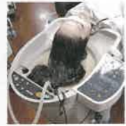
不要なものの排出と、トリートメントにパルマ液まで兼ねる美容法!!

唯一無二のケアで 本来の健康な状態へ! 佳永子さんでも一番ビックリしたのは、ノ 「朝には肩の重さが全然違う!と仰いますから。」 「私たちの『摩訶クリーム』は2年ですが、同じ理論の下で母は56年、私は27年間続けてきた結果として、「めぐり」を高めて相乗的に働かせることが大切だと「言えるんです。」 「編」長年実証されてきたからこそその重みがありますね!