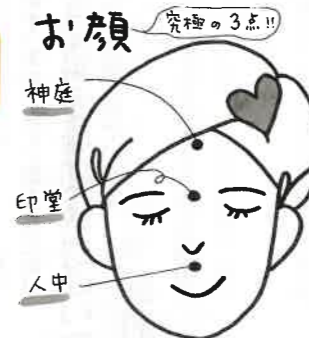
①人中: 鼻の下の溝の真ん中、 ②印堂: 眉と眉の間、 ③神庭: 神さまが降りてきて休む額の頂点