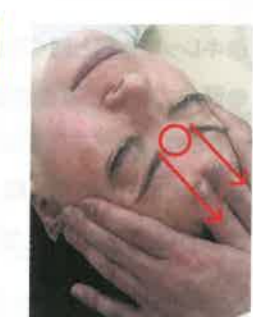
特に悩みを抱えて疲れたときにできる眉間の縦ジワは、「頭の酸欠」とも言われるので念入りに。印堂から眉に沿って左右にマッサージするのもオススメです。