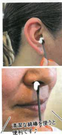
清潔な綿棒を使うと便利です。

さらに最高峰の和漢であり「魂が含まれている」とも称される「津液」(自分自身の唾液)が出やすくなるんです。『摩訶クリーム』でお顔のセルフケアをした後に、余裕があれば「津液を回す」瞑想をするのもオススメです。方法は、目を閉じて上あごに舌をつけ呼吸をするだけ。出てくる唾液を飲み込みながら、カラダ全体に気を循環させていくイメージで行えばメンタルと頭をよりスッキリさせることができますよ。