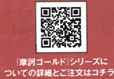
「摩訶ゴールド」シリーズについての詳細とご注文はコチラ!