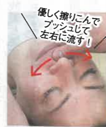
優しく擦りこんでプッシュして左右に流す! アゴから口の周りをマッサージしたら、「女性のためのツボ」と言われる人中を優しくプッシュ。さらに人中から口端に向かって左右に指を滑らせるようにマッサージ。そのときプッシュしていたら疲労が溜まっている証拠なので丁寧に流します。

①人中 めぐりを増やしてスムーズにする、女性にとって特に大切なツボです。急所でもあるので優しく擦りこみながら塗ります。軽い圧でプッシュしても心地よさが得られます。 ②印堂 ストレスを取ってリラックスさせる、頭に直結するスピリチュアルな部分。清々しくて純粋なエネルギーが入って吸収される大事な所なので、常