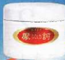
摩訶ゴールド クリーム (以下、摩訶クリーム)