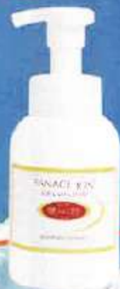
摩訶ゴールド 泡スキンソープ (以下、摩訶ソープ)