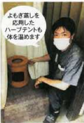
よもぎ蒸しを応用したハーブテントも体を温めます

たとえばおよそ30種類もの顔筋のうち、日常生活で使うのはその3分の1程度。ほとんどは動かさないので疲労物質が滞って固まりやすいのですが、深層の筋肉を動かす施術に「摩訶ゴールド」シリーズを使うと、めぐりを高めてカラダの入れ替わりサイクルが促進されるので美容の実感を得やすくなります。「施術に使っているクリームは何!? セルフケアにも使いたい!」というお客様の