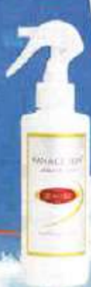
摩訶ゴールド ホワイトニング ローション (以下、摩訶ローション)