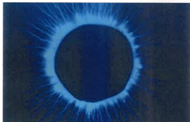
『摩訶クリーム』を塗ると、その生命エネルギー(イオン化ミネラル・電子)が体内に届く。写真は『摩訶クリーム』を写した様子。

すし、みんなもそう言ってくれます(笑)。 人は、ミトコンドリアが発電した電気信号で活動する生き物だという視点から見ると、『摩訶クリーム』を肌に塗ると不足したエネルギーがチャージされるという説明がすごく腑に落ちます。 篠原さん「鍼灸の神さまと言われていた濱添岡弘先生が、『摩訶クリーム』の力を解明したいとのことで、生命エネルギーを光としてとらえる特殊な機械で『摩訶クリーム』を撮影したら、クリーム全体が発光していたんです。「これが『摩訶クリーム』の生命力の源だろう」と濱添先生はおっしゃっていましたね。